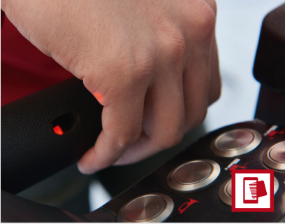
Sicherheitssensoren an beiden Griffen