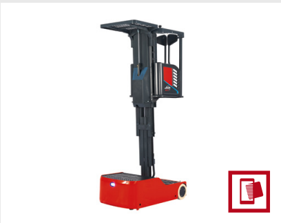
Optimiertes Kommissionieren auf der ersten und zweiten Ebene