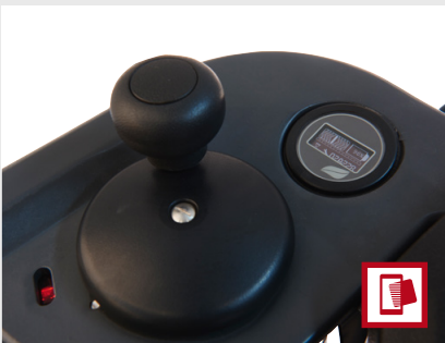
Alle Informationen auf einen Blick